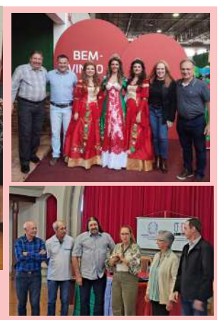
Momentos importantes de aproximação com a comunidade.